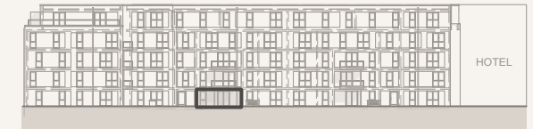
Ansicht Innenhof Nord (ohne Maßstab)