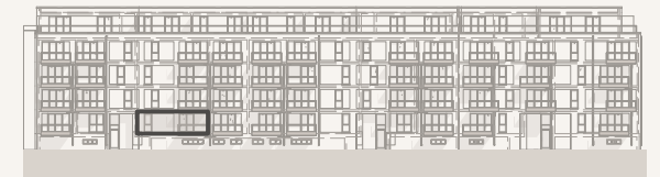
Ansicht 77er Straße (ohne Maßstab)