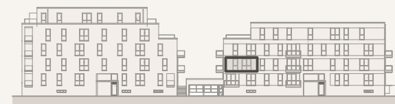
Ansicht Lisa-Korspeter-Straße (ohne Maßstab)