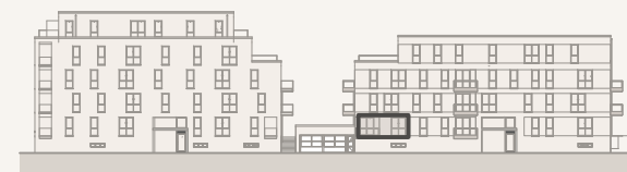
Ansicht Lisa-Korspeter-Straße (ohne Maßstab)