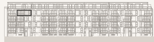
Ansicht 77er Straße (ohne Maßstab)