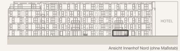
Ansicht Innenhof Nord (ohne Maßstab)