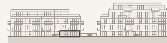
Ansicht Innenhof Süd (ohne Maßstab)